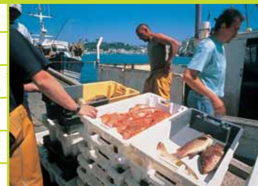
← Débarquement de pêche