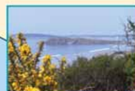
Île de l'Âber